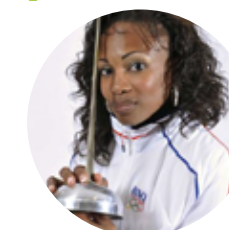
Laura Flessel Escrime