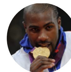
Teddy Riner Co-président Judo