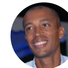
Stéphane Diagana Athlétisme