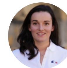
Marie Bochet Ski Alpin Paralympique