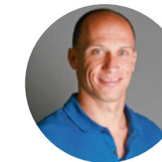
Florian Rousseau Cyclisme