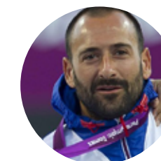
Michael Jérémiasz Tennis en fauteuil