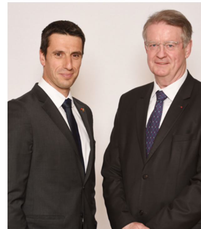
Tony Estanguet et Bernard Lapasset Co-Présidents