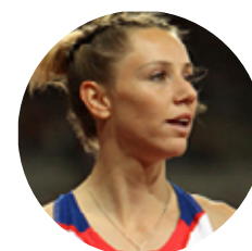
Marie-Amélie Le Fur Co-présidente Athlétisme Paralympique