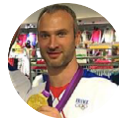
Thierry Omeyer Handball