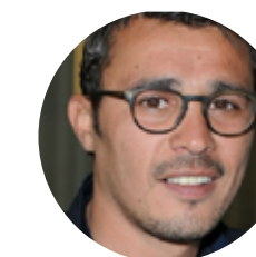
Brahim Asloum Boxe